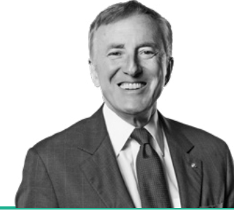
Ferit Bülent Eczacıbaşı Yönetim Kurulu Başkanı

Ferit Bülent Eczacıbaşı liderliğindeki 6 üyeden oluşan Yönetim Kurulu'nda 2 bağımsız üye bulunmaktadır. Yönetim Kurulu Başkanı ve Genel Müdür farklı kişiler olup, Yönetim Kurulu üyeleri icracı değildir.